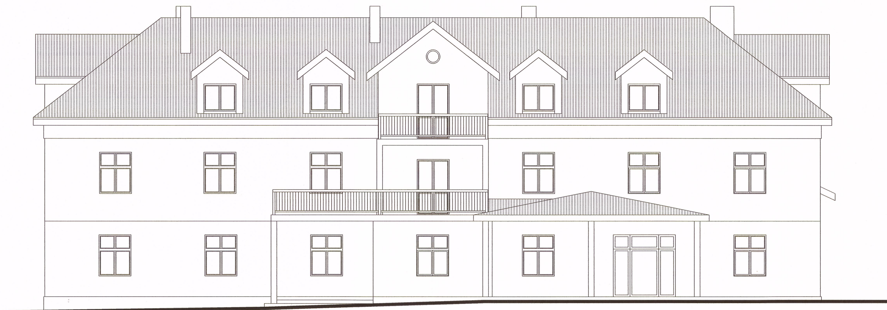
ELEWACJA FRONTOWA - WSCHODNIA